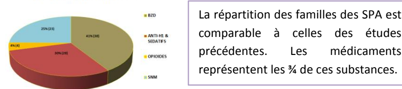
FAMILLES DE SUBSTANCES DANS LA SCV 2017